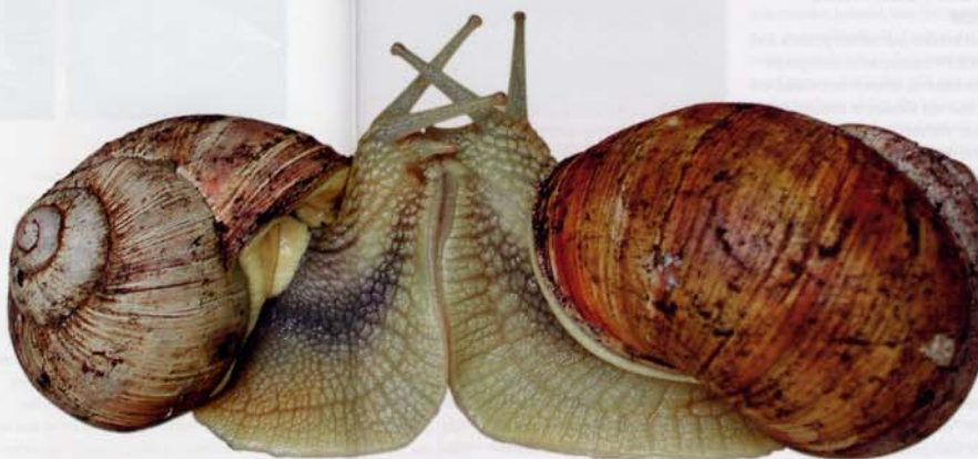
Links: De Japanse slak Euhadra subnimbosa . Dit dier heeft het meest extreme pijlschietgedrag dat tot nu bekend is. De Japanse slakken besteken hun partner gemiddeld ruim drieduizend keer.